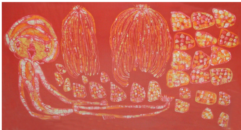
tessuto batik decorato da Letizia