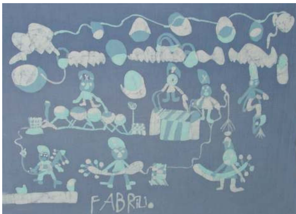
tessuto batik decorato da Fabrizio