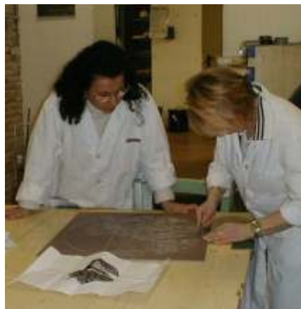
...e per finire due stelle di operatrici!

Nel cielo brillano molte stelle che danno luce ad ogni cosa, riscaldano il mondo immenso dando gioia e amore intenso. L'amicizia è un sentimento che lega il mondo intero