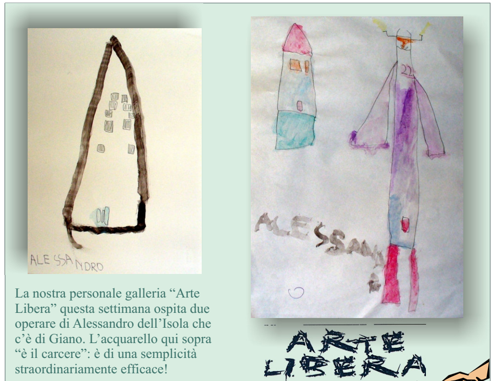
La nostra personale galleria "Arte Libera" questa settimana ospita due opere di Alessandro dell'Isola che c'è di Gianò. L'acquarello qui sopra "è il carcere": è di una semplicità straordinariamente efficace!

progetto come nodo di una unica rete. Una rete che si modella in funzione delle esigenze individuali, tutti i giorni feriali (ma non esclusivamente) dalla mattina alla sera. Dunque auguri per la nuova avventura a Olinda, Saxmin, Il Sentiero, Penelope, BimBumBam, Young People, hAcolori... e perché no, a "non solo fra di noi"!