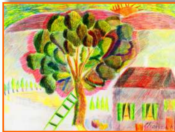
La casa in campagna di Michela