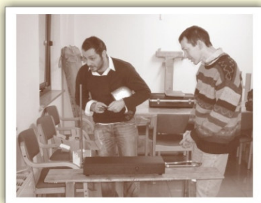
21 gennaio 2008, il Theremin approda ai centri "Millecose"