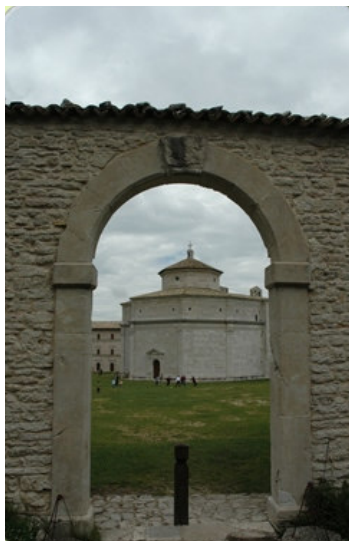
La "corte" dell'Abbazia della Madonna di Macereto che negli anni 80 ospitava i soggiorni estivi (vedi il punto) dei Servizi Diurni dell'area handicap di Spoleto.