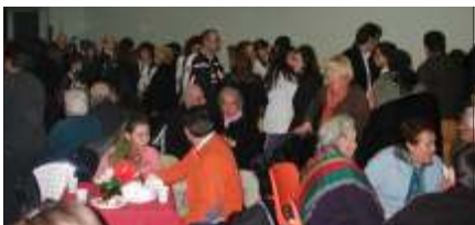
Ci staremo tutti?