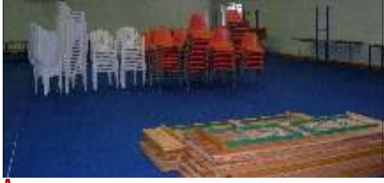
Arrivano tavoli e sedie...