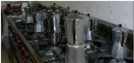
Un caffè e poi...