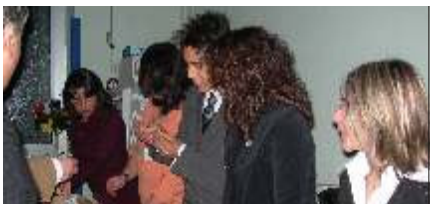
...impeccabilmente al lavoro!