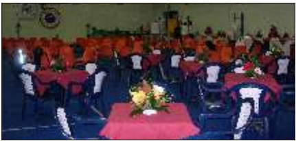
...le sale sono pronte, arriverà qualcuno?