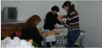
Mentre si finisce di imbottire i panini...