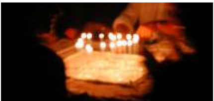
Tanti auguri (stanchi, sfuocati, ma felici...)