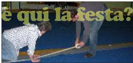
Ma quanta è questa moquette?!...