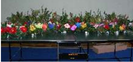
...e dagli anziani i mitici centrotavola.