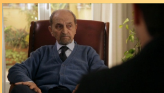
in fondo a destra