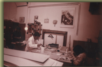
Anvedi Nando modello 1987 ca.