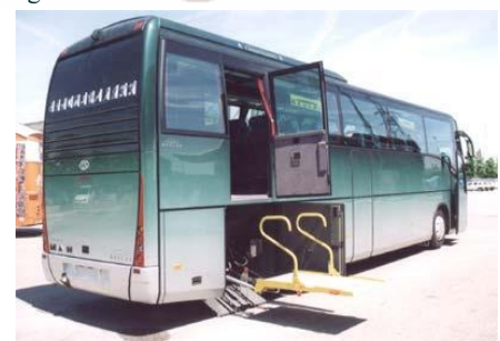
OSA news - n.65- 28 novembre 2014

Per le persone con problemi di mobilità sono stati organizzati parcheggi e percorsi brevi e agevoli.