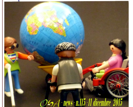
OSA-news - n.115 - 11 dicembre 2015

Torniamo al tema dell'accessibilità provando, come nella news scorsa, ad osservarlo nell'ambito delle celebrazioni della Giornata Internazionale delle Persone con Disabilità. Tra tutte e tante parole spese l'appello più significativo, metafora insieme di una "nuova" cultura dell'accessibilità e dell'azione operativa e pragmatica necessaria non solo per abbattere le barriere ma soprattutto per evitare di realizzarne di nuove, le parole conclusive del discorso di Ban Ki-moon, segretario generale delle Nazioni Unite: "...Spostiamo il mondo in avanti!"