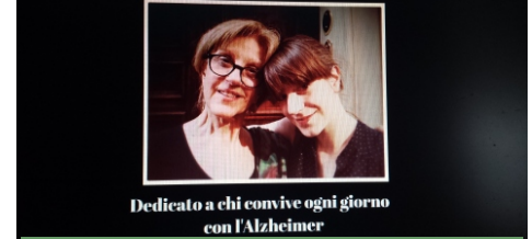
Dedicato a chi convive ogni giorno con l'Alzheimer

dei loro sentimenti ma nonostante tutto,non riesce a tenerle così distanti come sembra.