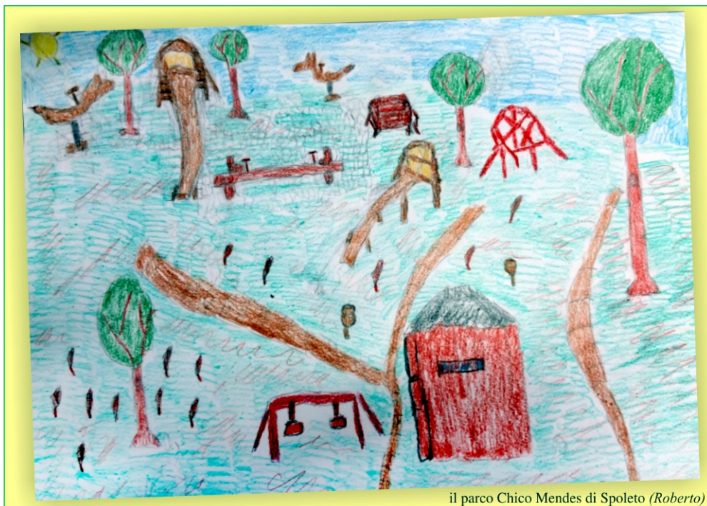
il parco Chico Mendes di Spoleto (Roberto)

Sei capitoli divisi in brevi paragrafi con il grande potere di dare un nome alle nostre sensazioni e gli strumenti per gestirle al meglio.