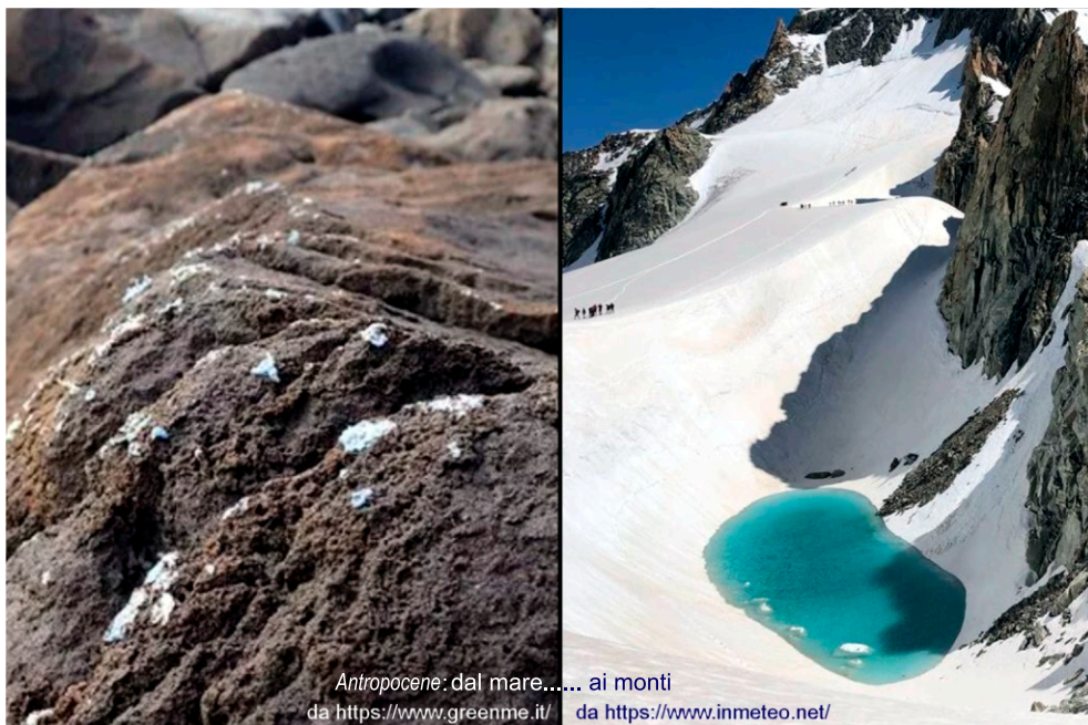
Antropocene: dal mare..... ai monti