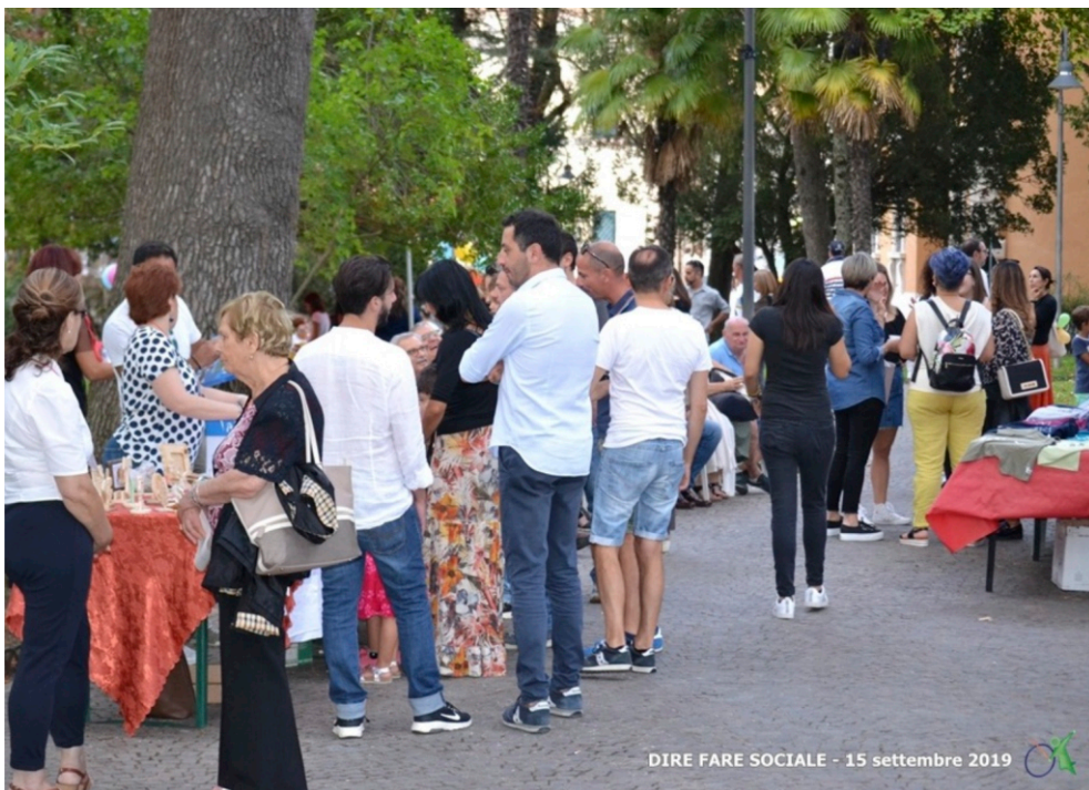
DIRE FARE SOCIALE - 15 settembre 2019

...dire, fare e sociale è anche l'occasione per l'estrazione della lotteria. Forse l'unica in Italia (ma azzarderemmo anche a livello planetario) a chiamarsi... "La Lotteria"!