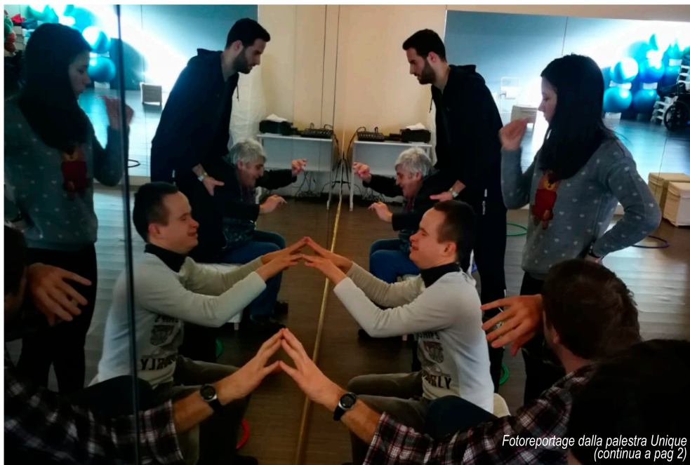
Fotoreportage dalla palestra Unique (continua a pag 2)