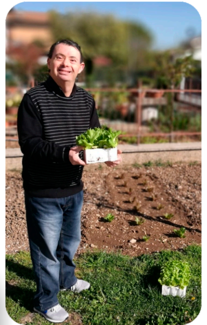
Noi approfittiamo per fare un po' di orto