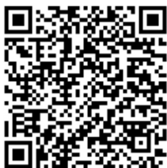
Save the Children - Atlante dell'infanzia a rischio 2020

Ancora oggi minori palestinesi sono detenuti nelle carceri israeliane, secondo i dati raccolti da Defense for Children International - Palestine "in particolare, ogni anno Israele detiene e persegue tra 500 e 700 bambini palestinesi nei tribunali militari. Quasi tre