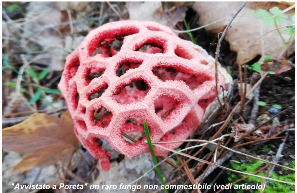
"Avvistato a Poreta" un raro fungo non commestibile (vedi articolo)